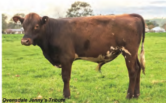
Ovensdale Jenny's Tribute