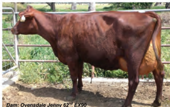
Dam: Ovensdale Jenny 62 nd EX90