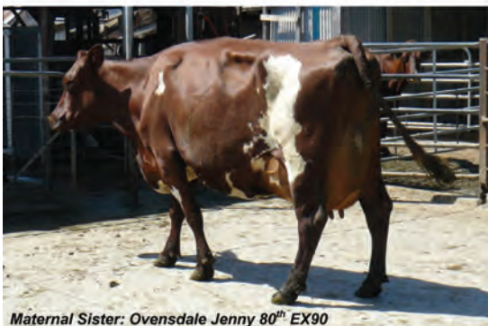
Maternal Sister: Ovensdale Jenny 80 th EX90